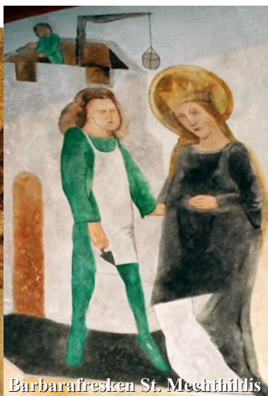
Barbarafresken St. Mechthildis